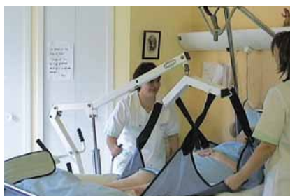
La prévention à l'hôpital préserve la santé des soignants et améliore la qualité du soin grâce à des outils de mobilisation (verticalisateur, lève-malade, drap de glisse...).