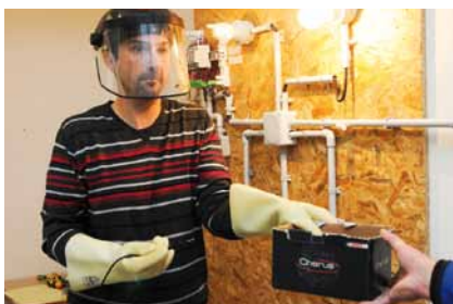
Formation à l'habilitation électrique sur panneau pédagogique. Le risque électrique nécessite des protections et des procédures très spécifiques.

L'employeur veille à l'adaptation de ces mesures pour tenir compte du changement des circonstances et tendre à l'amélioration des situations existantes.